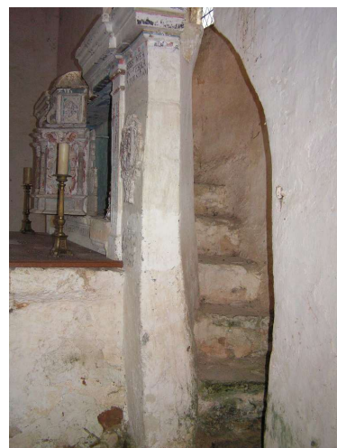
Varennes-l'Enfant, chaire sur autel

Dans les églises médiévales, se trouvait une chaire mobile en bois destinée à la prédication ; les chaires fixes n'apparaissent qu'au 16 e siècle après le concile de Trente (1545-1563). Les prédications se faisaient souvent en plein-air, Hors département (Saint-Lô, Vitré, Nantes ...), nous pouvons rencontrer des tribunes extérieures insérées dans le bâti d'églises. 1 2