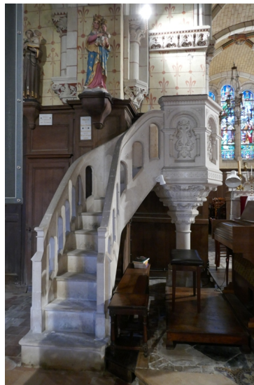
Beaulieu-sur-Oudon, chaire en pierre