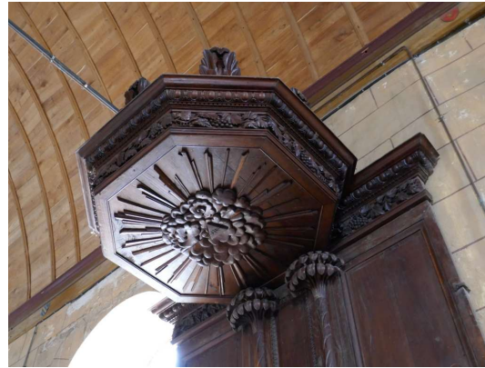
Maisoncelles, abat-voix, représentation de la Trinité