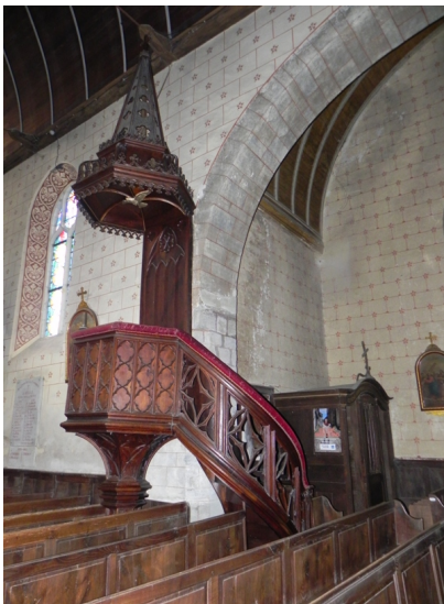
Cuillé, chaire en bois

Une chaire peut être construite en bois, en pierre ou en métal. D'autres matériaux comme le cuir mais aussi des incrustations, des dorures ou des scènes peintes peuvent servir à les embellir.