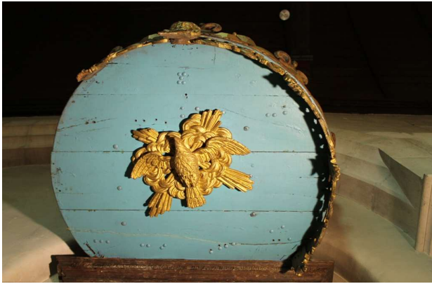
Argentré, abat-voix : représentation du St Esprit