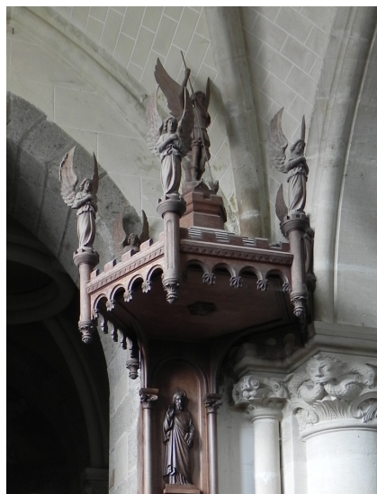
Carelles, abat-son et dorsal