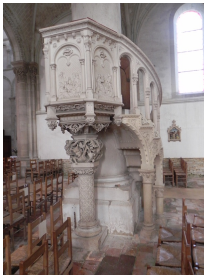
Cossé-le-Vivien, chaire sur pilier