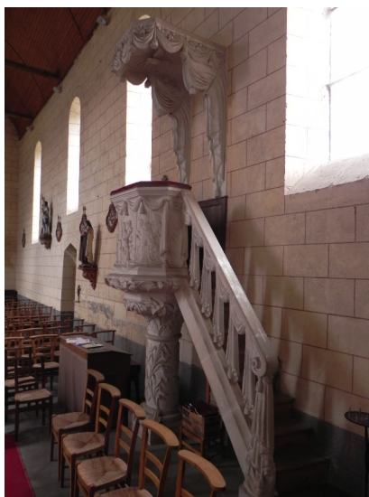
Bouessay, chaire adossée au mur