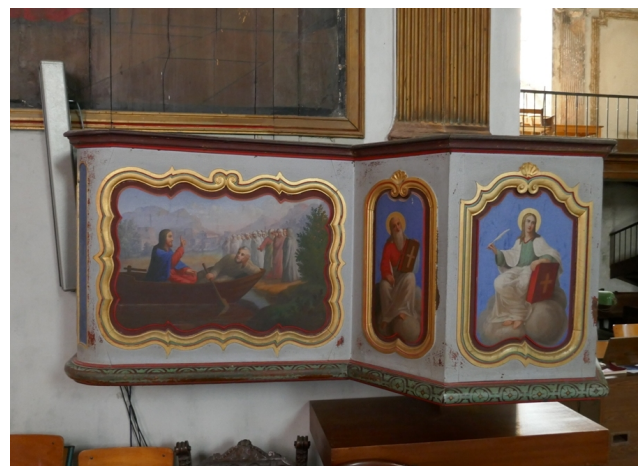
Le Bourgneuf-la-Forêt, cuve