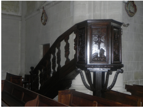
Assé-le-Béranger et Saint-Aignan-de-Gennes, chaires privées de dais

Aujourd'hui, les chaires qui n'ont pas de valeur patrimoniale ont souvent été déposées mais la protection au titre des monuments historiques n'est pas une garantie de conservation. La cuve a été parfois transformée en ambon. Souvent dorsal et abat-voix ont été démontés sous prétexte de sécurité ... et ont disparu.