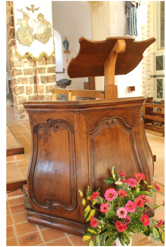
Nuillé-sur-Vicoin, cuve transformée en ambon

Et pour terminer, quelques photos de chaires remarquables