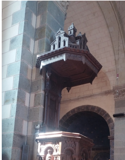
La Chapelle-Anthenaise, abat-voix