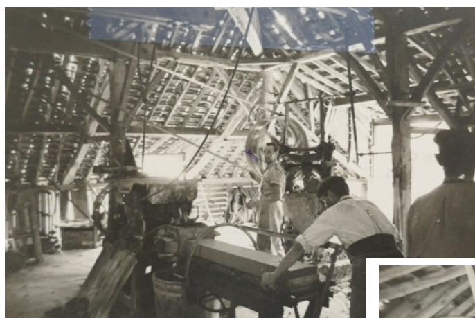
Intérieur de la briqueterie.