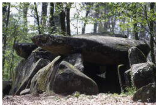
Allée couverte de la Contrie à Ernée ph. B Boufflet

Chantier archéologique du cinéma Le Maine à Laval, par Jean-Michel Gousset