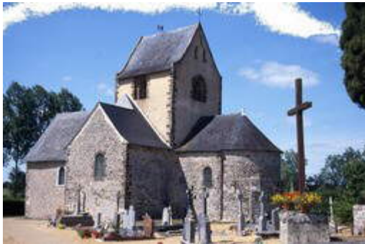
Eglise de Bannes