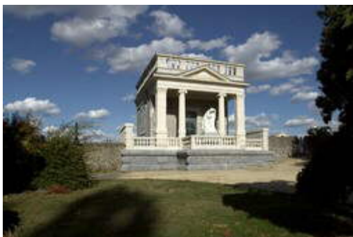
Mausolée de la famille Robert-Glétron à Vaiges