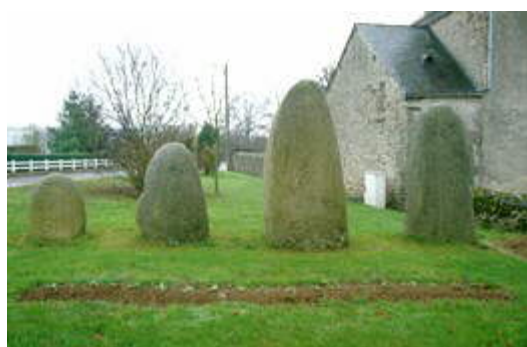
Stèles de l'âge du Fer à Marcillé-la-Ville

- Les nécropoles gallo-romaines de Jublains, par