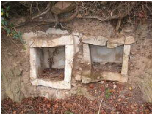
Sarcophages mérovingiens à Saulges