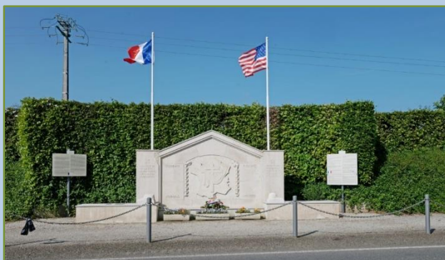
Monument au lieu-dit Le Petit Val